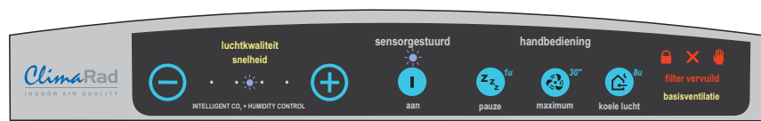
Bedieningspaneel type I

Het ClimaRad ventilatietoestel bedient u met het bedieningspaneel aan de bovenzijde van het toestel.