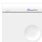
CO 2 -sensor

via de CO 2 -sensor (optioneel) (standaard instelling; 1.000 ppm)