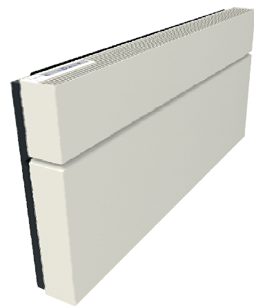
ClimaRad Care H1C