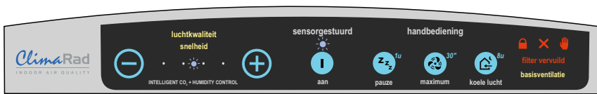
Bedieningspaneel type I

Het ClimaRad ventilatietoestel bedient u met het bedieningspaneel aan de bovenzijde van het toestel.