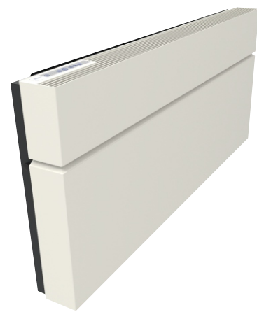
ClimaRad Care H1C