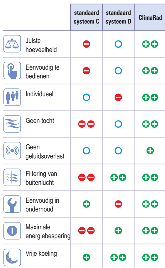
Tabel 3: Criteria voor een goed ventilatiesysteem

Systeem C: centrale luchtafvoer en decentrale ventilatioosters voor luchtaanvoer.