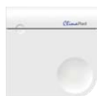
externe CO 2 -Sensor

über den externe CO 2 -Sensor (optional) (Standardeinstellung: 1.000 ppm)