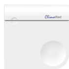
CO 2 -sensor

via de CO 2 -sensor (optioneel) (standaard instelling; 1.000 ppm)