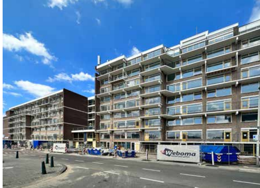
Het uit twee delen bestaande Uiterjooon tijdens de renovatie.

Uiterlijk is er nauwelijks iets veranderd aan het zorgcomplex, buiten de nieuwe terrassen om dan. Veel kozijnen en glas zijn vernieuwd. Balkonhekken zijn vervangen en balkonvloeren gerepareerd, er is nieuwe zonwering gemonteerd (die automatisch dicht gaat bij harde wind) en het ziet er allemaal weer fris uit. De grote veranderingen vonden binnen plaats. "Prent Landman Architecten heeft naast het bouwkundige ontwerp ook het interieurontwerp verzorgd voor het nieuwe Uiterjooon", vervolgt Raaijmakers. "Dat begint bij de hoofdentree, dat met warme kleuren en materialen een welkome ontvangst biedt. Rechts sluit de hal direct aan op het petit café en de daarachter gelegen recreatieruimte, links ligt het zorg- en behandelcentrum. Beiden zijn afgewerkt in diverse kleurtinten, houtmotieven op de vloeren en bloembehang. Deze lijn is doorgetrokken in de huiskamers, waarbij elke huiskamer zijn eigen kleurstelling heeft met passend meubilair."