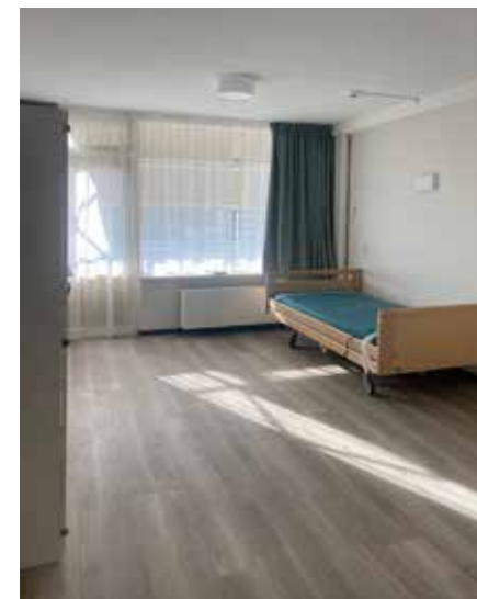
Alle ruimtes zijn voorzien van ClimaRad-units voor verwarming en koeling, die van de kamers zijn gekoppeld aan het gebouwbeheersysteem.

ders van het prachtige uitzicht op de haven en zee genieten. Inmiddels hebben de eerste bewoners hun intrek genomen in het gerenoveerde Uiterjooon. ■