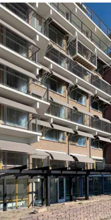
Balkonhekken zijn vervangen, balkonvloeren gerepareerd, er is nieuwe zonwering gemonteerd en het ziet er allemaal weer fris uit.

Modbus Modules ten behoeve van het geïnstalleerde gebouwbeheersysteem, dat de gewenste kamertemperatuur op afstand kan regelen en eventuele bijzonderheden kan uitlezen. Op deze eenvoudige manier kan voldaan worden aan de individuele behoeftes van de bewoners en medewerkers, mede bij zeer hoge en lage temperaturen." ■