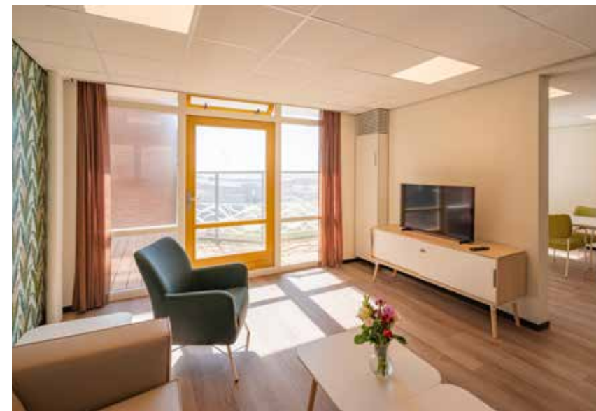
ClimaRad Ventura VIC units in de gemeenschappelijke ruimtes.