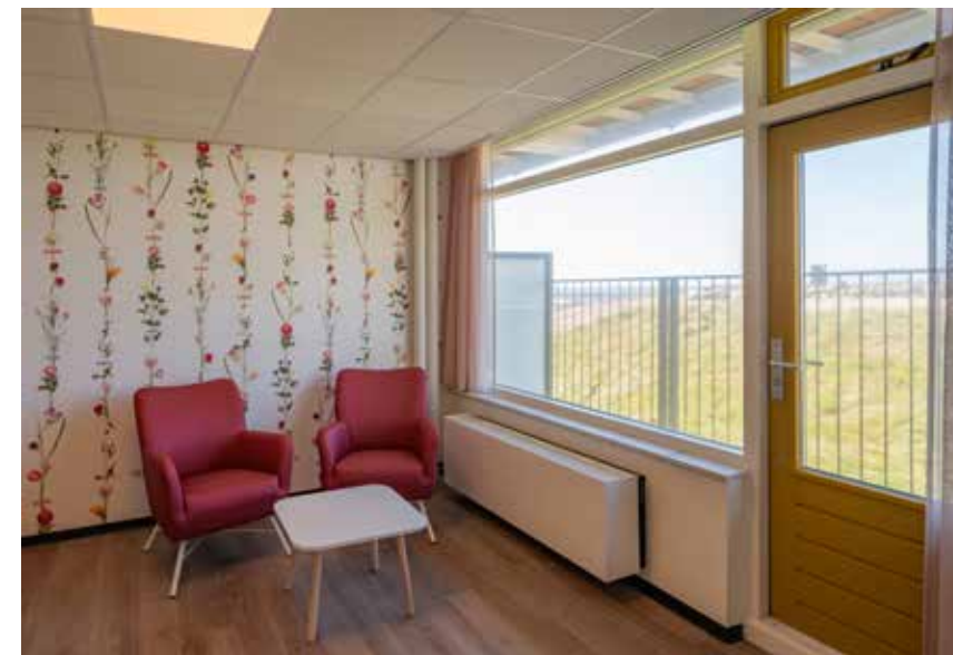
De ClimaRad Vita H1C: ventilatie, verwarming en koeling ineen.

Tekst | ClimaRad