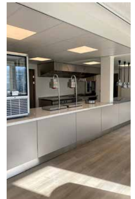
Keuken en afhaalbalie van het petit restaurant.