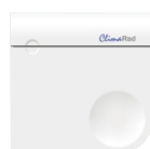
CO 2 -sensor

via de CO 2 -sensor (optioneel) (standaard instelling; 1.000 ppm)